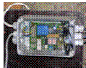
Le groupe transfert et régulation