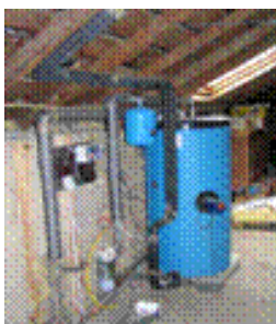
Le ballon solaire

Le chauffe-eau solaire est constitué de trois éléments essentiels :