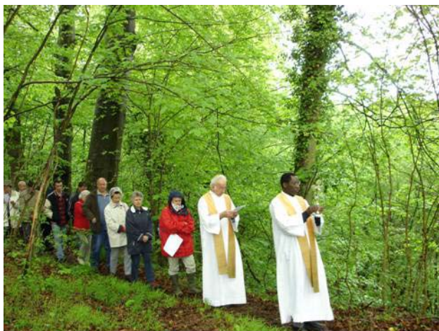
12h00 : Procession autour de la butte.