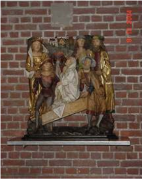
Le musée de Lille