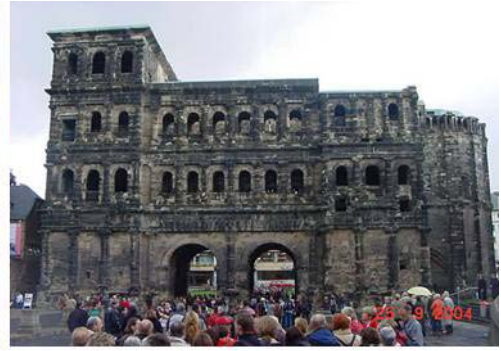
Trèves et la Porta Nigra