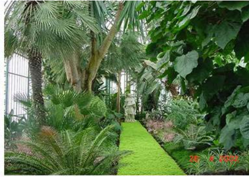
Les serres de Laeken