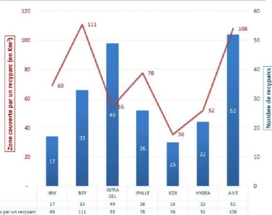
Le coût des déchets ménagers en Wallonie | Densité du réseau de recyparcs wallons

Comme le montre ce graphique, si le nombre de recyparcs est plus élevé sur le territoire de l'AIVE, la couverture géographique de ceux-ci est aussi plus importante qu'ailleurs avec, en moyenne, 108 km 2 couverts par parc, alors qu'un recyparc couvre une zone de 36 km 2 dans la région de Charleroi.