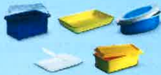
Barquettes et rapiers