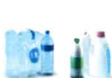
Emballages en plastique, métalliques et cartons à boissons