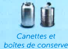
Canettes et boîtes de conserve