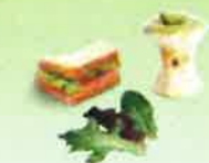
Restes de repas